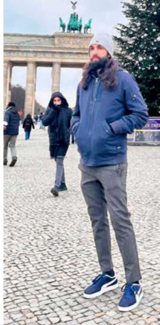
Wie sehen Deine Zukunftspläne aus?

Zeit und Geld habe ich sowieso während meiner Ausbildung leider nicht so viel, aber wenn es mir irgendwann möglich sein sollte, würde ich gerne reisen, weil ich andere Kulturen kennenlernen möchte. Aber das hat Zeit, bis alle äußeren Bedingungen dafür geschaffen sind.